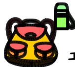
4年→ エコライフ紀北