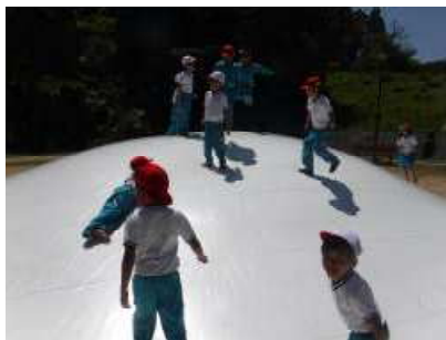
← 1年 杉村公園やすらぎ広場