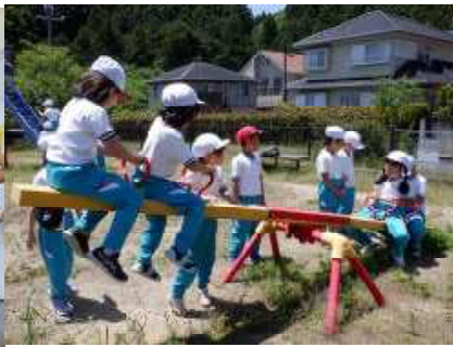
2年 三石台の各公園